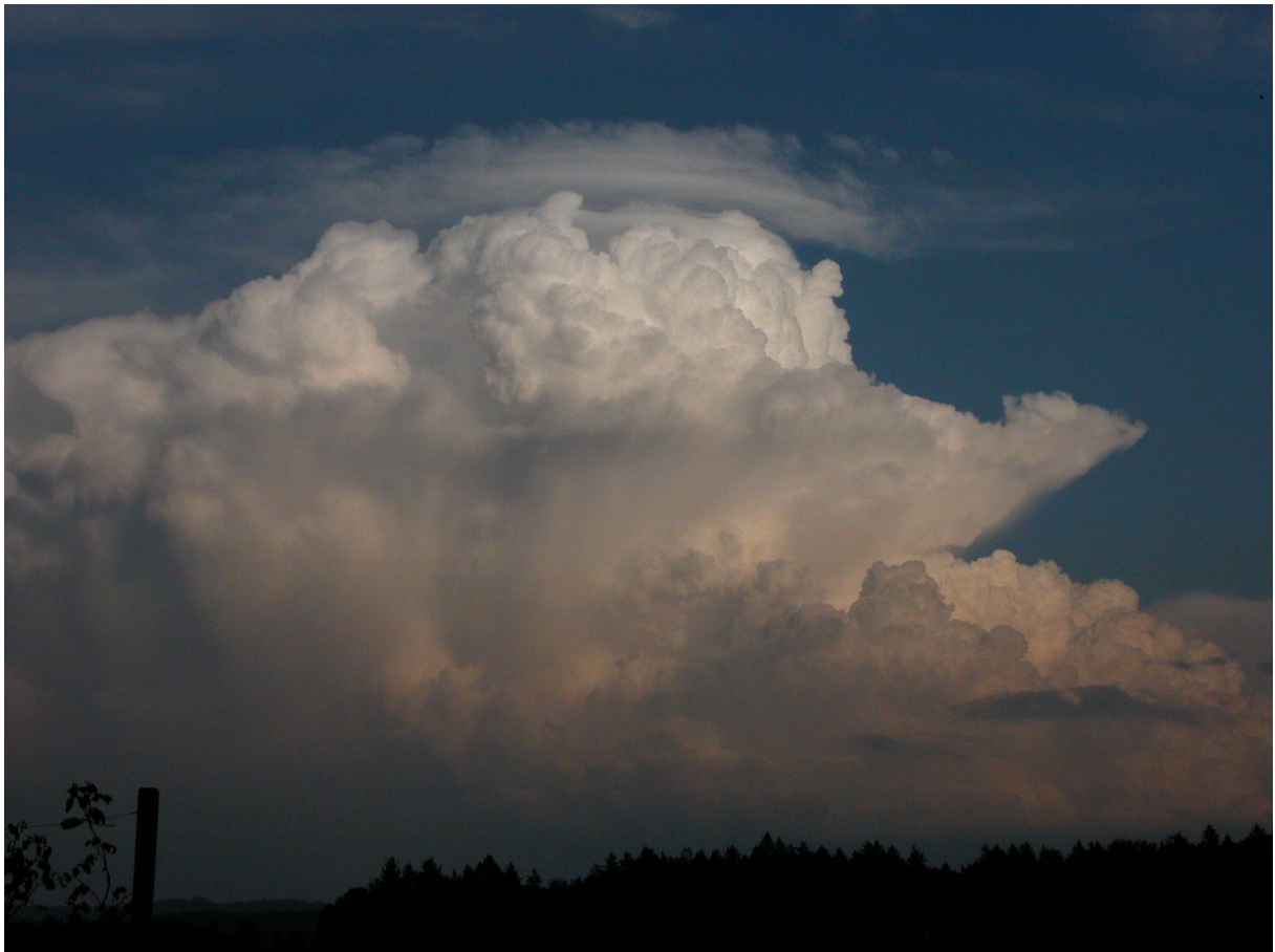
Gewitterstimmung am 7. August