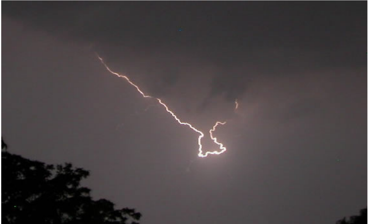
Gewitter am 3. August